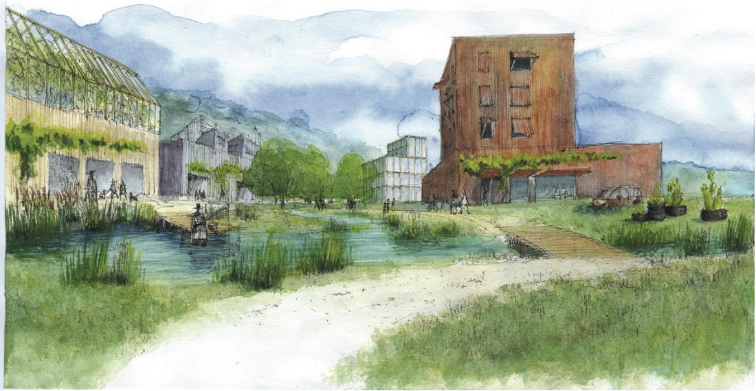
Les gravières de VELLE-SUR-MOSELLE en 2054