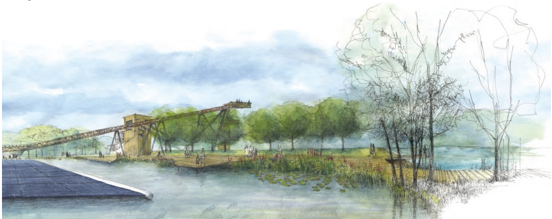
FRAIMBOIS vue d'un drone en 2054