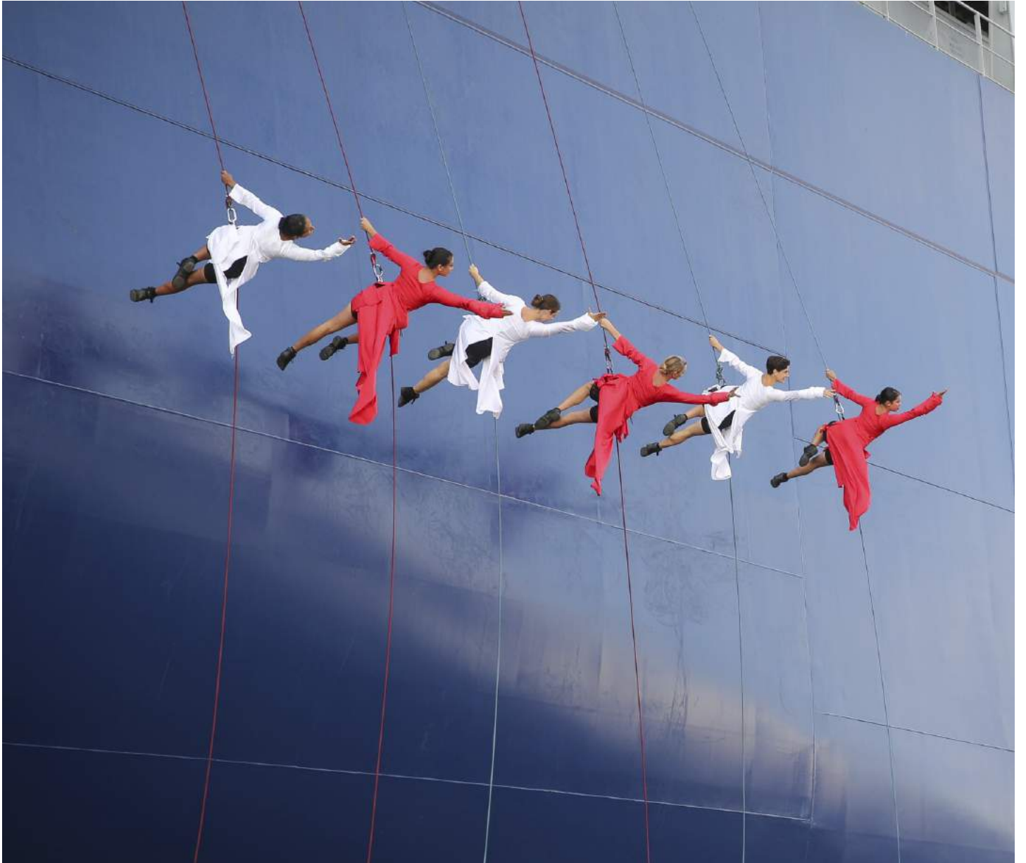
Le Havre - Baptême bateau - 2018