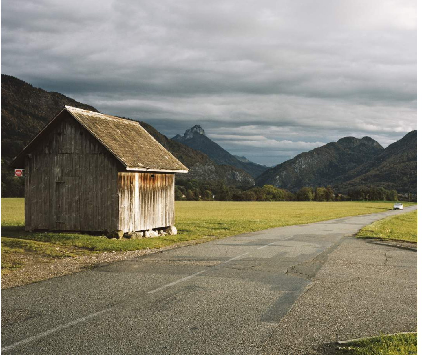
Route des Vignes, Villaz