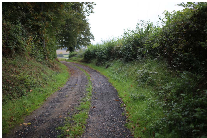
CAUE de Loir-et-Cher