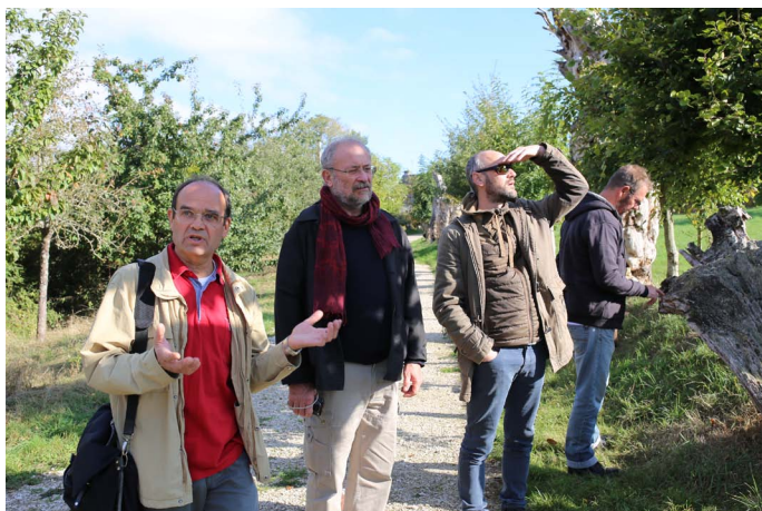
CAUE de Loir-et-Cher