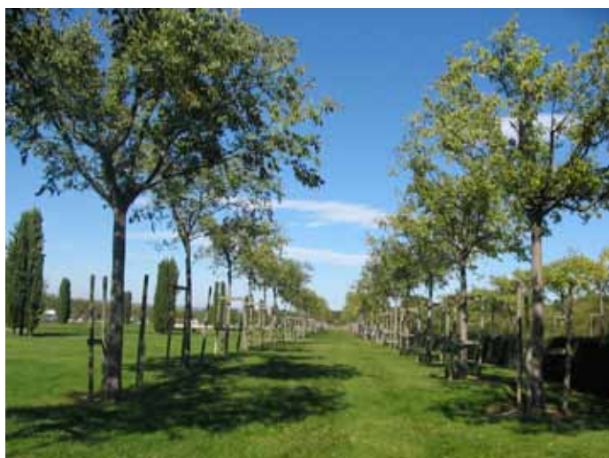
Les alignements de micocouliers