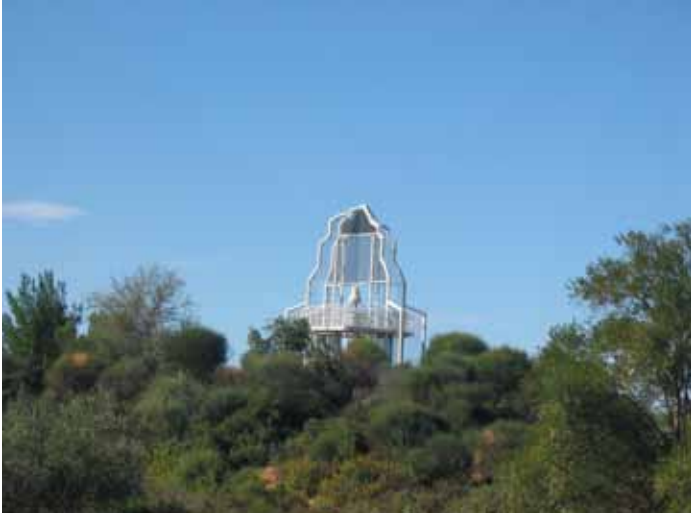
Deux belvédères évoquant la tour Magne dominant les lieux