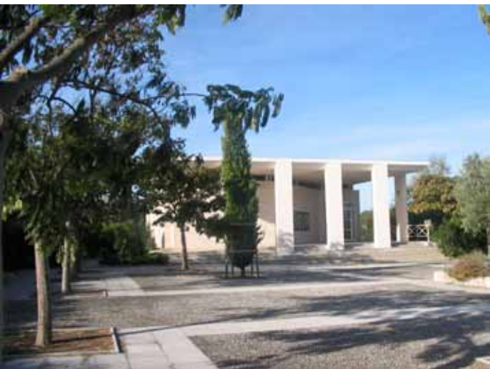
La calade devant le musée

Il évoque la culture préhistorique du bassin languedocien. On y trouve des scènes de la vie quotidienne de l'époque.