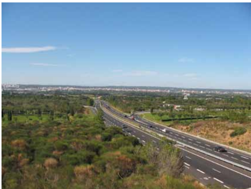
Le terrain, du haut de la costière : garrigue, vallée du Vistre et en arrière-plan, la ville de Nîmes

Le programme était de réaliser des parkings pour poids lourds et véhicules légers, installer des toilettes et mettre en situation un petit musée destiné à rendre compte de la découverte, lors de terrassements autoroutiers près de l'aire, de vestiges gallo-romains.