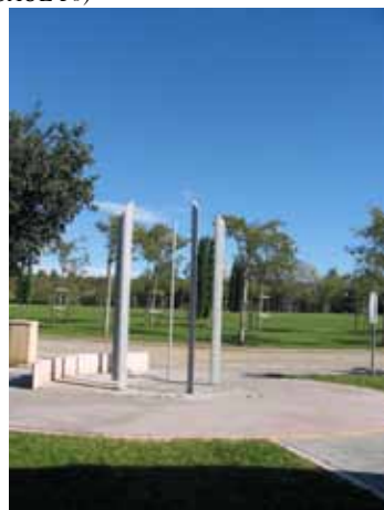
Les douches au design contemporain

Comme on ne pouvait se contenter d'une vue imprécise sur la ville, a été suggérée l'idée d'élever, sur chaque partie de l'aire, un belvédère, l'un d'un étage, l'autre de deux, en fonction de leur position sur le site.