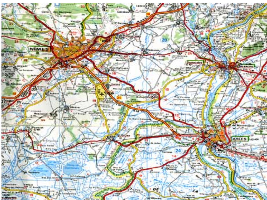
L'aire-jardin, entre Nîmes et Arles

L'originalité du lieu repose sur la modernité du parc, sur ses dimensions et sa beauté et, au delà des services habituels d'une aire d'autoroute, sur sa vocation historique et culturelle.