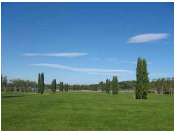
La grande pelouse et les triales de cyprès