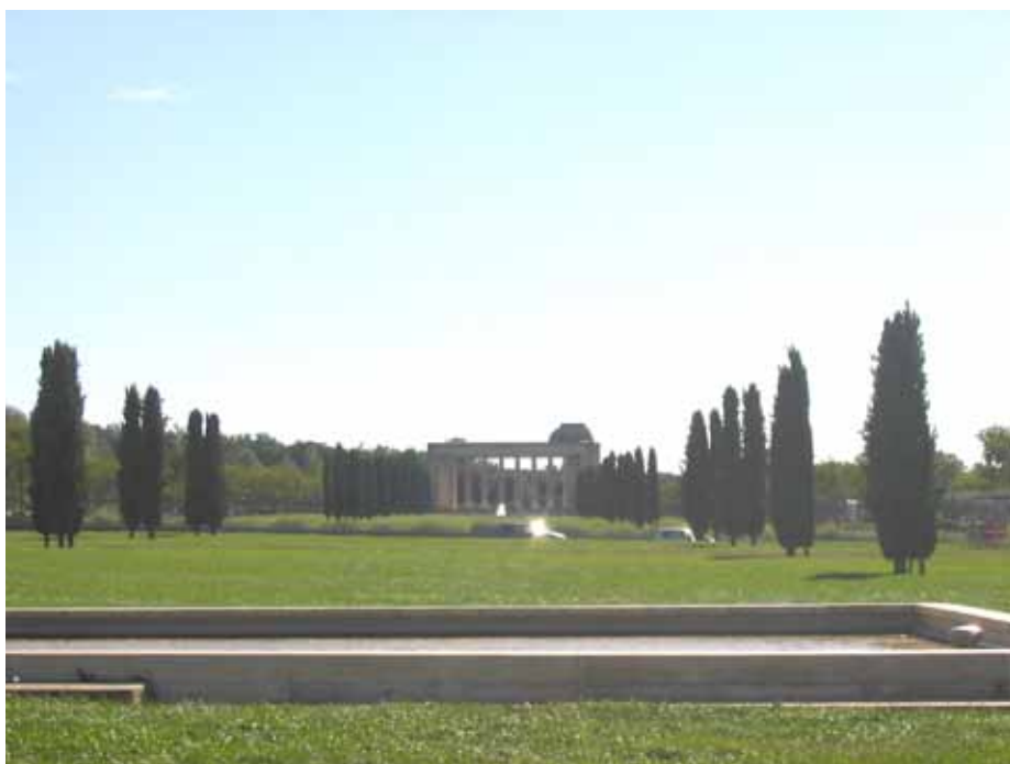
L'aire de Nîmes-Caissargues : la seule aire d'autoroute répertoriée dans les jardins