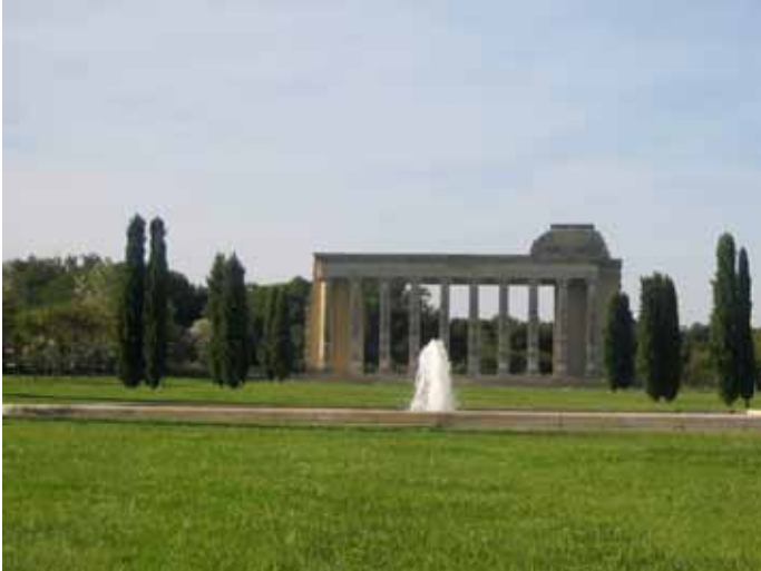
Les colonnes de l'ancien théâtre dans la perspective du mail