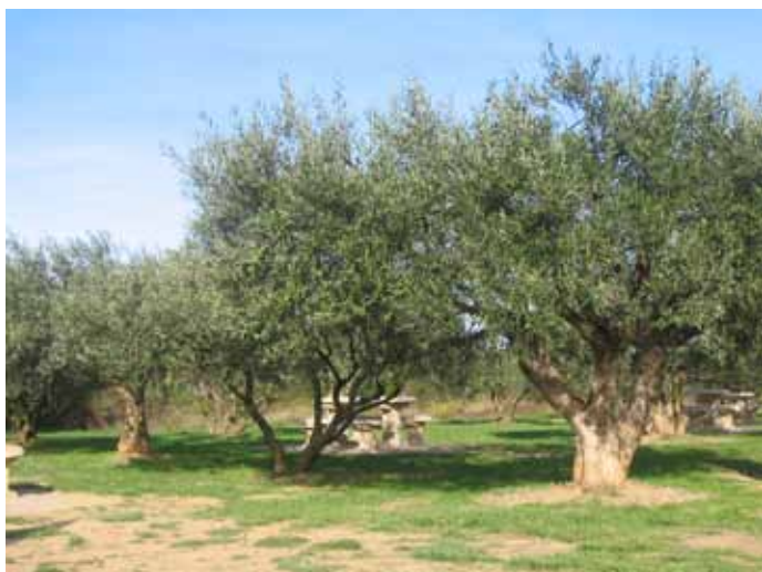
Les oliviers

Cette aire de repos est alors constituée, de part et d'autre de l'autoroute, d'un jardin moderne le long d'une promenade bordée d'arbres.