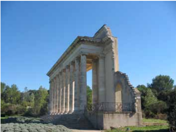
Un souvenir de la vie culturelle nîmoise