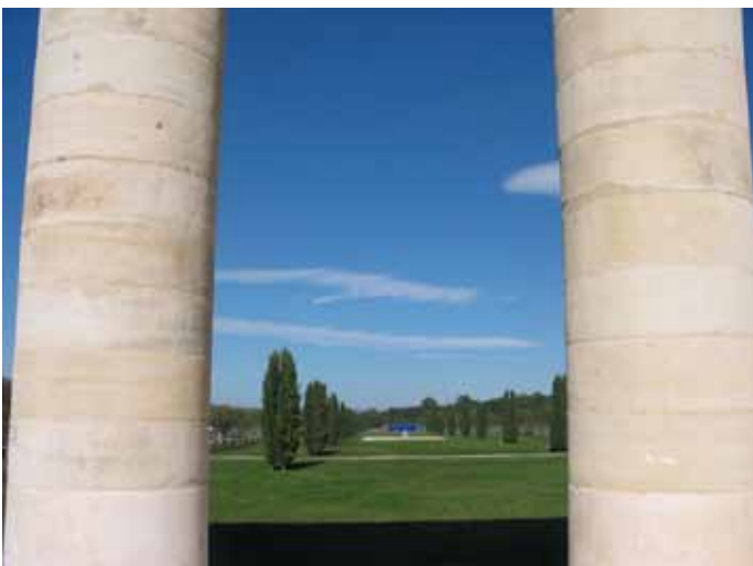
Une vue offerte sur le jardin

L'ancien théâtre de Nîmes, construit par l'architecte Meunier en 1827 avait été incendié en 1952. Il n'en restait que les colonnes de la façade principale, lesquelles avaient été protégées au titre des Monuments historiques en 1949.