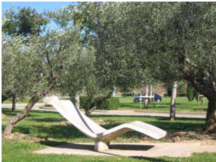
Les chaises longues de l'aire d'arrêt : un mobilier original