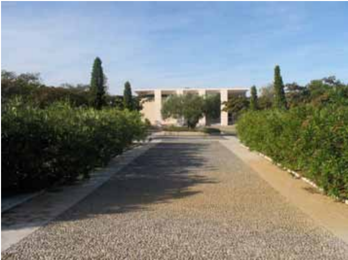
L'allée menant au musée et l'olivier bicentenaire au devant de l'édifice

Avant le commencement des travaux de cette portion d'autoroute entre Nîmes et Arles, des recherches archéologiques avaient été entreprises par la Direction Régionale des Antiquités à la demande des ASF.