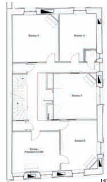
1 er étage