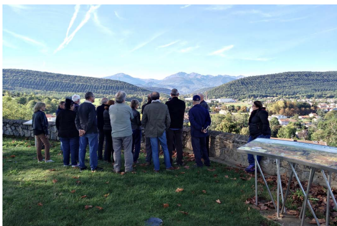
CAUE de l'Ariège