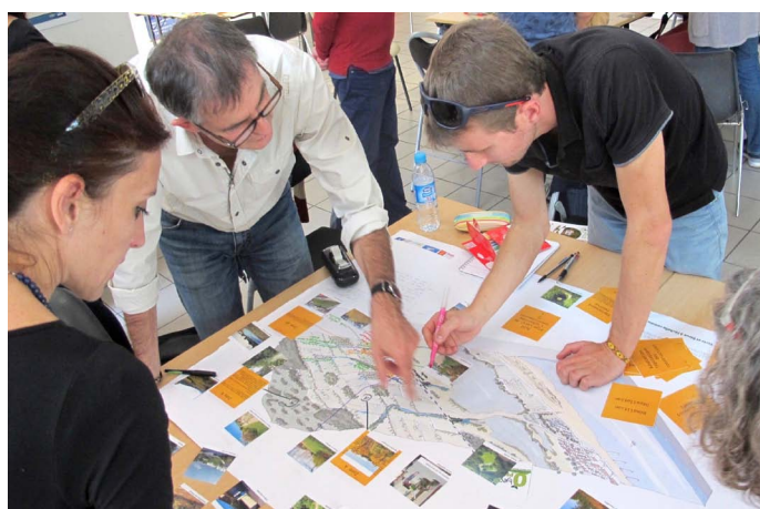
CAUE de l'Hérault