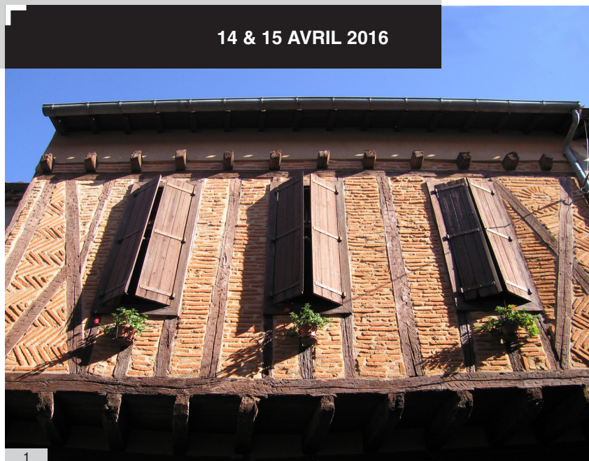
1. Détail de l'étage en pan-de-bois d'une maison, Sorèze, 81 2. Hypothèse de restitution 19 rue du Maquis, Sorèze